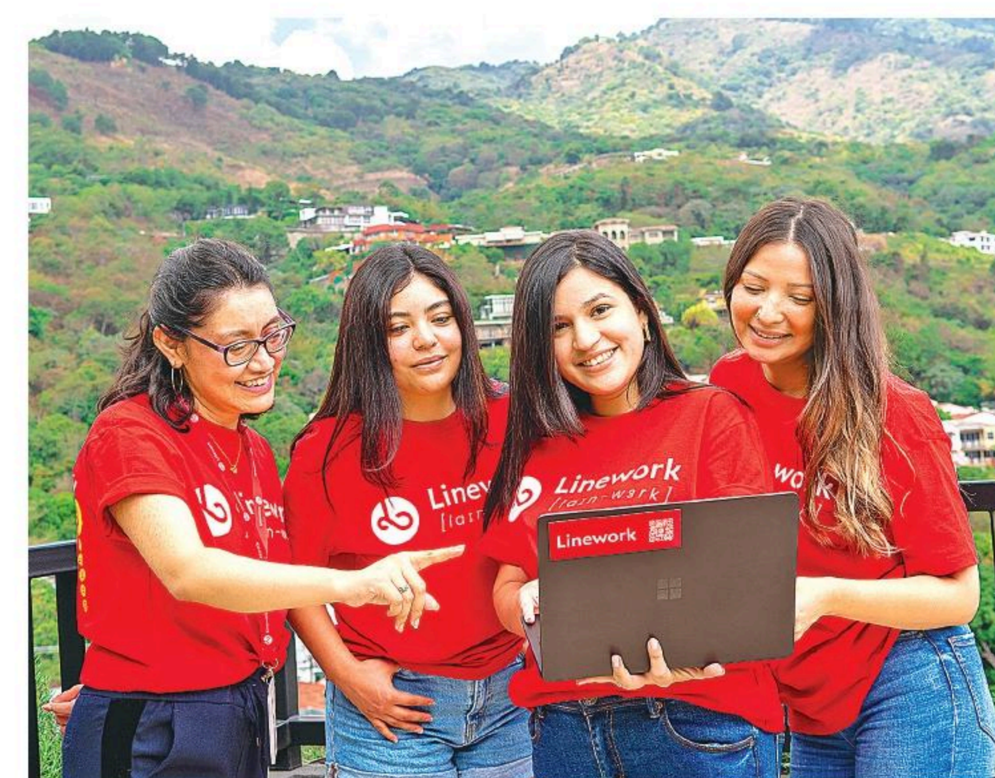
El equipo de Linework en El Salvador, con un fuerte liderazgo femenino, impulsa una revolución financiera que redefine el futuro de las transacciones digitales.

universitarios en El Salvador, promover eventos culturales y facilitar el acceso a recursos tecnológicos mediante sus sistemas de finanzas descentralizadas. Esta estrategia no solo busca fomentar la inclusión financiera, sino también transformar la economía local al empoderar a las comunidades con herramientas innovadoras y sostenibles.